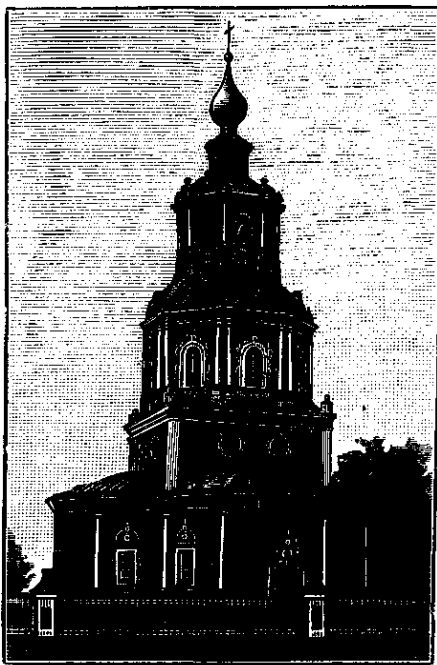
Церковь в с. Уборы под Москвой.

друга. К назначенному времени церкви он не выстроил. Рассерженный боярин подал в Приказ каменных дел прошение о привлечении Я. Г. Бухвостова к ответу. В Рязань поскакал пристав для ареста зодчего. Но безрезультатно, так как «поймать себя он, Якунка, не дал и от них, посыльных людей, ушёл». Во избежание дальнейших неприятностей, Яков Бухвостов сам явился к Шереметеву и заключил с ним новый подряд с обязательством закончить всю постройку к июлю 1696 г. Но он вновь не смог выполнить взятого на себя обязательства. Опять ему пришлось бежать. Но на этот раз его поймали, посадили «за решётку» и судили. Приговор Приказа каменных дел обязывал «его, Янку, бить кнутом нещадно и каменное дело ему доделать». Шереметев, однако, сообразил, что исполнение приговора в первой его части грозило совсем приостановить постройку. Он сам попросил освободить зодчего. Постройка церкви в Уборах была закончена.